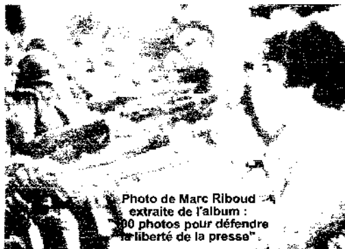
Photo de Marc Riboud extraite de l'album : 90 photos pour défendre la liberté de la presse